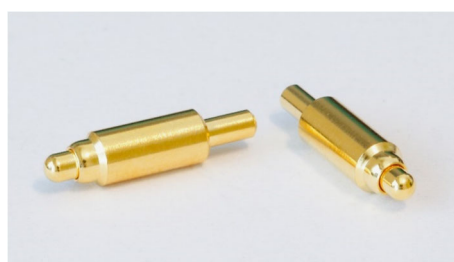
15A高定格スプリングコネクタ

(注) ニュースリリースに記載されている内容は報道発表日時点の情報です。その後、予告なしに変更する可能性があります。あらかじめご了承ください。