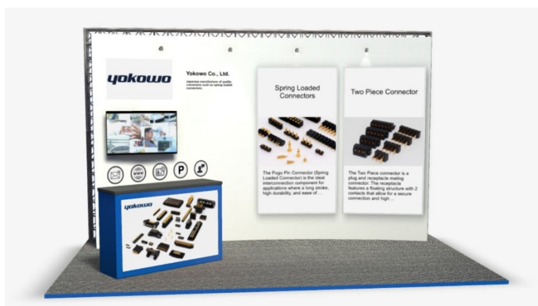
バーチャルブースの展示イメージ

～ 今年8月に発表した15A高定格スプリングコネクタの展示の他、新製品の展示も予定 ～